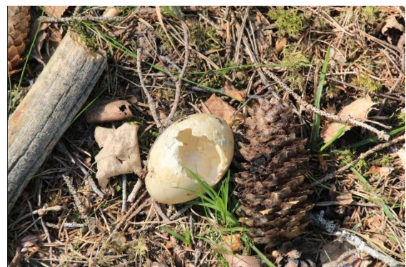
Plundrat ägg från sjöfågel