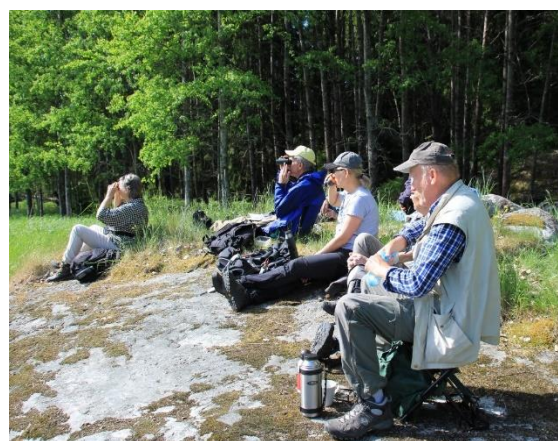
Rast vid Rudsjön.