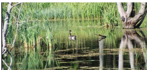
Grågås med ungar